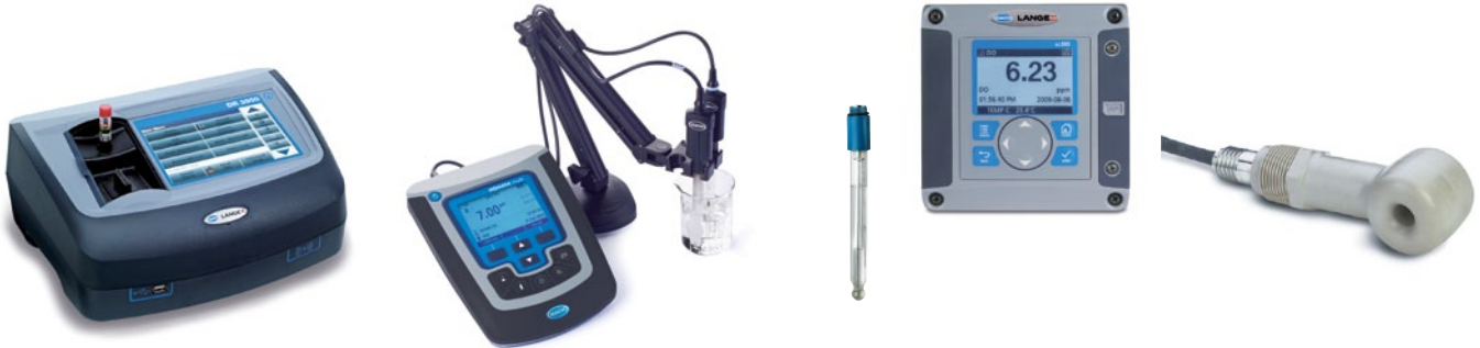
Laboratuvar analizi için kaplama banyolarına özel testlerle masa üstü ve portatif cihazlar Denetim, bakım ve ekipman kalifikasyonu hizmetleri mevcuttur

* Diğer parametreler ve çözümler için lütfen yerel HACH LANGE temsilcinizle iletişime geçin veya web sitemizi ziyaret edin.