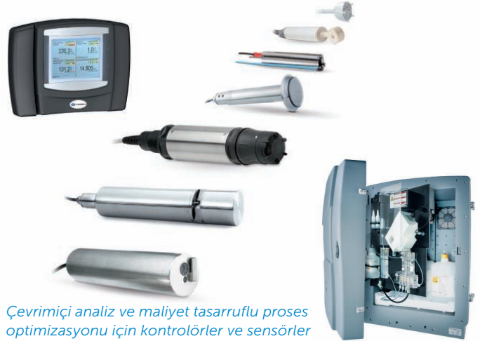
Çevrimiçi analiz ve maliyet tasarruflu proses optimizasyonu için kontrolörler ve sensörler