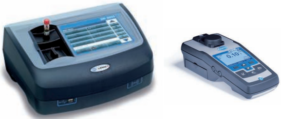
Laboratuvar analizi denetimi, bakımı ve ekipman kalifikasyonu hizmetleri için tezgah üstü ve portatif cihazlar

* Ek parametreler ve çözümler için lütfen yerel HACH LANGE temsilcinizle iletişime geçin veya web sitemizi ziyaret edin.