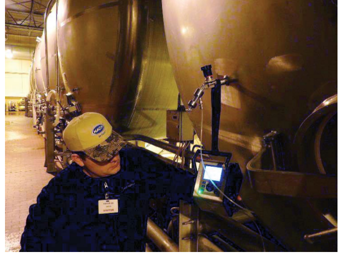
Şekil 4. Online doğrulama için kullanılan portatif Orbisphere 3100

Buna karşılık düşük aralıklı LDO sensörlerindeki sensör spotu yılda bir kez değiştirilir ve kalibre edilir. Bu işlemleri yüksek aralıklı sensörle de gerçekleştirmeyi planlıyorlar; ancak 6 aylık aralıklarla. Bakım nedeniyle yıllık tesis kapatma zamanı genellikle en az talebin olduğu Ocak ayında gerçekleşir. Bu nedenle söz konusu ay LDO sensörlerini değiştirmek ve kalibre etmek için en ideal aydır.