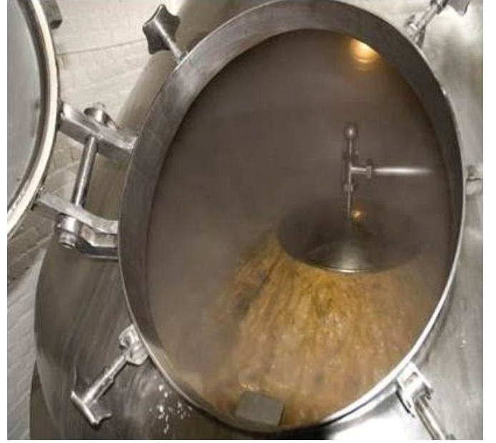
Şekil 1. Mayşe Fermantasyonu

Saf oksijen veya hava, mayşe hatlarına enjekte edilerek fermantasyona yardımcı olunur. Bu, maya solunumunu artırmak için yapılmaz. Fermantöre maya eklendikten sonra maya hızlıca oksijeni absorbe eder ve bunu membran biyosentezinde kullanır. Oksijen, maya hücrelerinin çok daha hızlı büyümesini ve daha fazla hücre yoğunluğuna ulaşmasını sağlar. Ancak ÇO seviyeleri, örneğin 20 ppm'de kontrol edilerek, fermantasyon hızının doğru oranda ilerlemesi sağlanır. Fermantasyon çok uzun sürerse üretim ertelenir; çok kısa sürerse de aroma bu durumdan etkilenir.