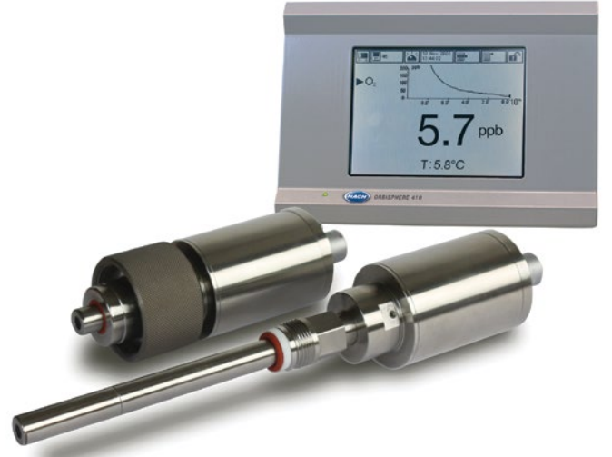
Şekil 5. Fermantasyon yönetimi için ideal olan yüksek aralıklı LDO sensörleri