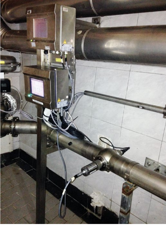
Şekil 2. Hach 410 Kontrol Üniteleri – tipik kurulum